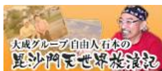
会議長ブログ：自由人石本の毘沙門天世界放浪記

最後になりましたが、梅雨と同時に猛暑の時期が参ります。ご体をご自愛下さい。みなさまの益々の発展と健勝を祈ります。